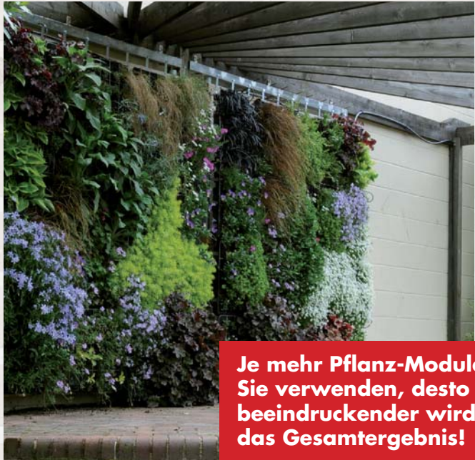
Je mehr Pflanz-Module Sie verwenden, desto beeindruckender wird das Gesamtergebnis!

Mit GreenFront® sind Sie in der Lage an jeder Wand einen Garten zu erschaffen. Lassen Sie Ihrer Kreativität freien Lauf und erfreuen Sie sich an lebendigen Farbwelten.