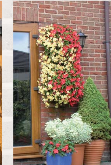
Ihr Wandgarten mit Sommerblumen!