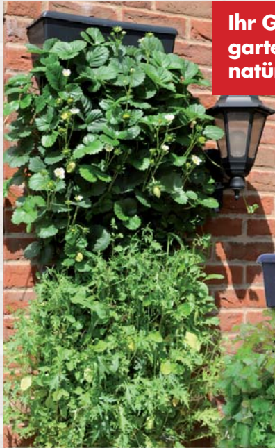
Ihr Gemüse- und Kräutergarten an der Wand – natürlich + schneckenfrei!