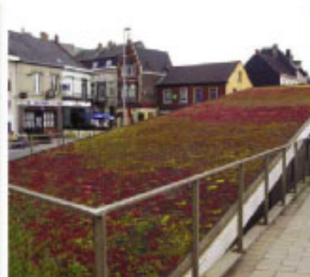
• Für Flach- und Steildächer - geeignet für jede Dachabdichtung