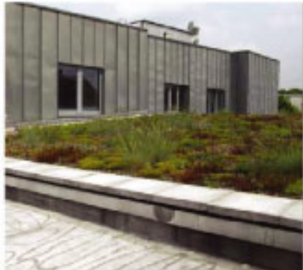
• Extensiv Begrünung - Moos, Sedum, Kräuter, Gräser