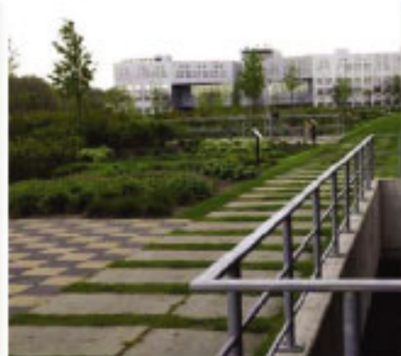
• Intensiv Begrünung - Rosen, Stauden, Gehölze, Bäume