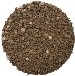
Baumsubstrat BS-1 / BS-2